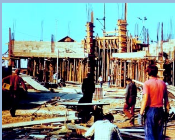
Budowa kościoła pw. Miłosierdzia Bożego w Skawinie

W dniu 11 listopada 1999 r. w 81. rocznicę odzyskania niepodległości przez Polskę władze Miasta i Gminy Skawina nadały po raz pierwszy tytuł Honorowego Obywatela Miasta i Gminy Skawina Jego Ekscelencji Księdzu Biskupowi Kazimierzowi Nyczowi. W ten dzień w kościele Miłosierdzia Bożego odbyła się uroczysta Eucharystia, której przewodniczył i wygłosił homilię Dostojny Gość. Dalsze uroczystości miały miejsce w hali widowiskowo-sportowej, gdzie przy licznie zgromadzonej publiczności, reprezentantach wszystkich szczebli samorządu, przedstawicielach Kościoła, środowisk lokalnych, organizacji i instytucji, Jego Ekscelencja przyjął tytuł Honorowego Obywatela Miasta i Gminy Skawina. W trakcie uroczystej sesji Rada Miejska podjęła wtedy uchwałę o treści: „Nadaje się Honorowe Obywatelstwo Miasta