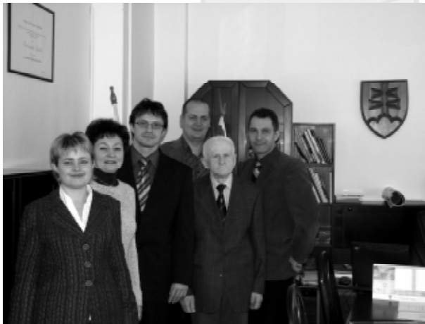
Wizyta w Urzędzie Miasta.