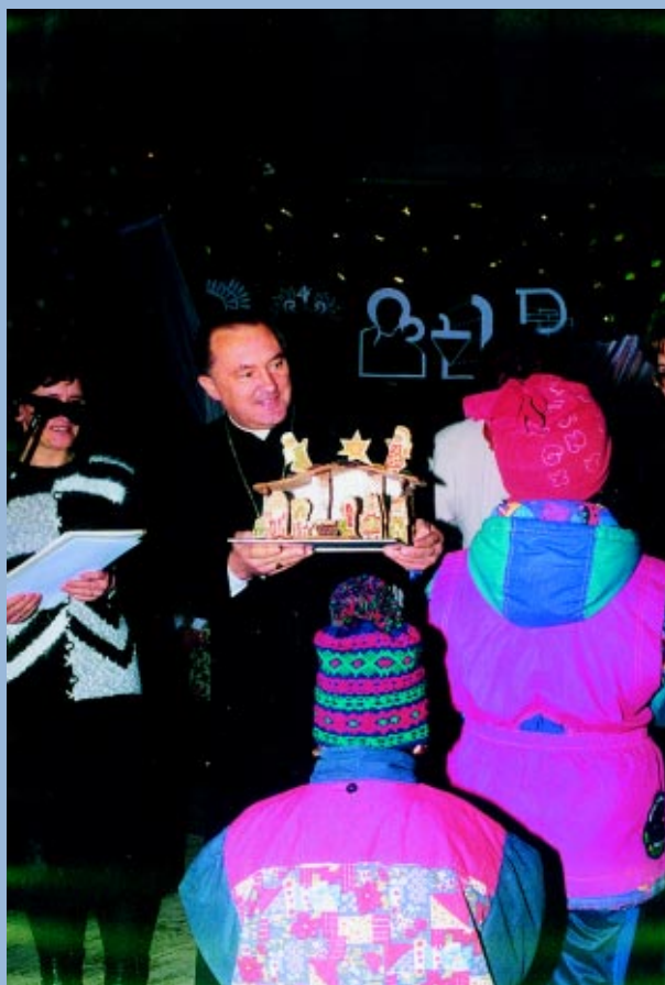
Konkurs szopek w 1999 roku