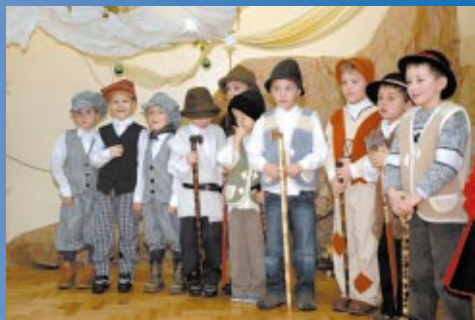
Przedszkola str. 20