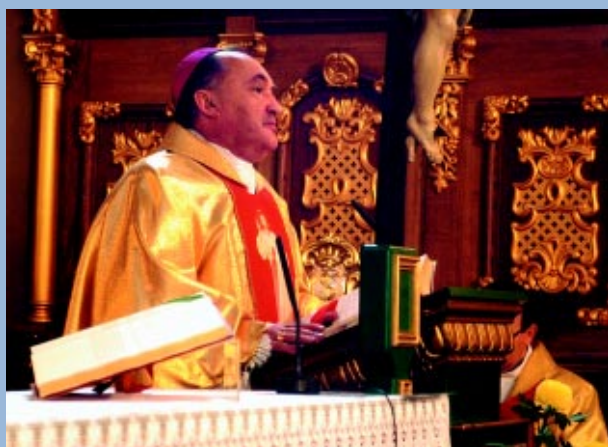
Uroczysta msza 11 Listopada 2003 roku