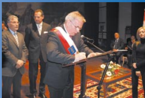
Współpraca z miastami partnerskimi str. 24