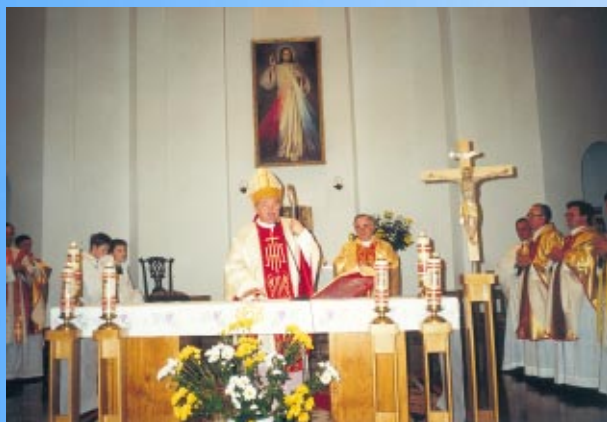
11 Listopada 1999 roku, msza w trakcie uroczystości nadania tytułu Honorowego Obywatela Miasta i Gminy Skawina