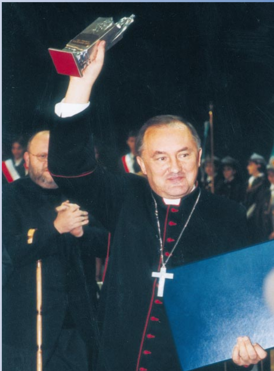
Arcybiskup Kazimierz Nycz str. 2, 35-36