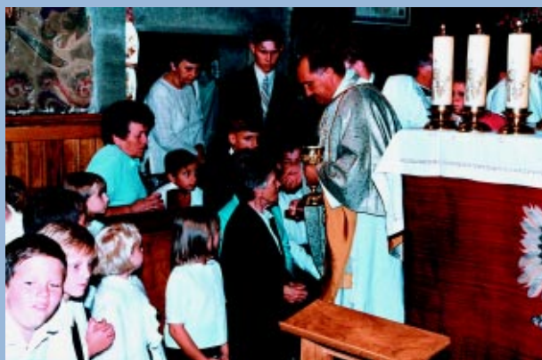
Radziszów, 1997 rok