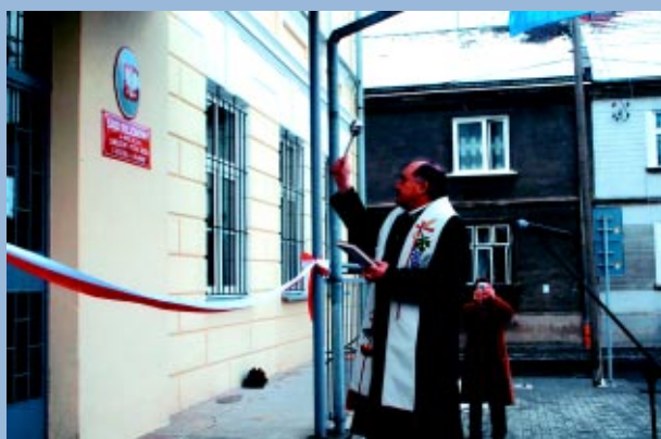
Poświęcenie budynku Sądu Grodzkiego, luty 2004 rok