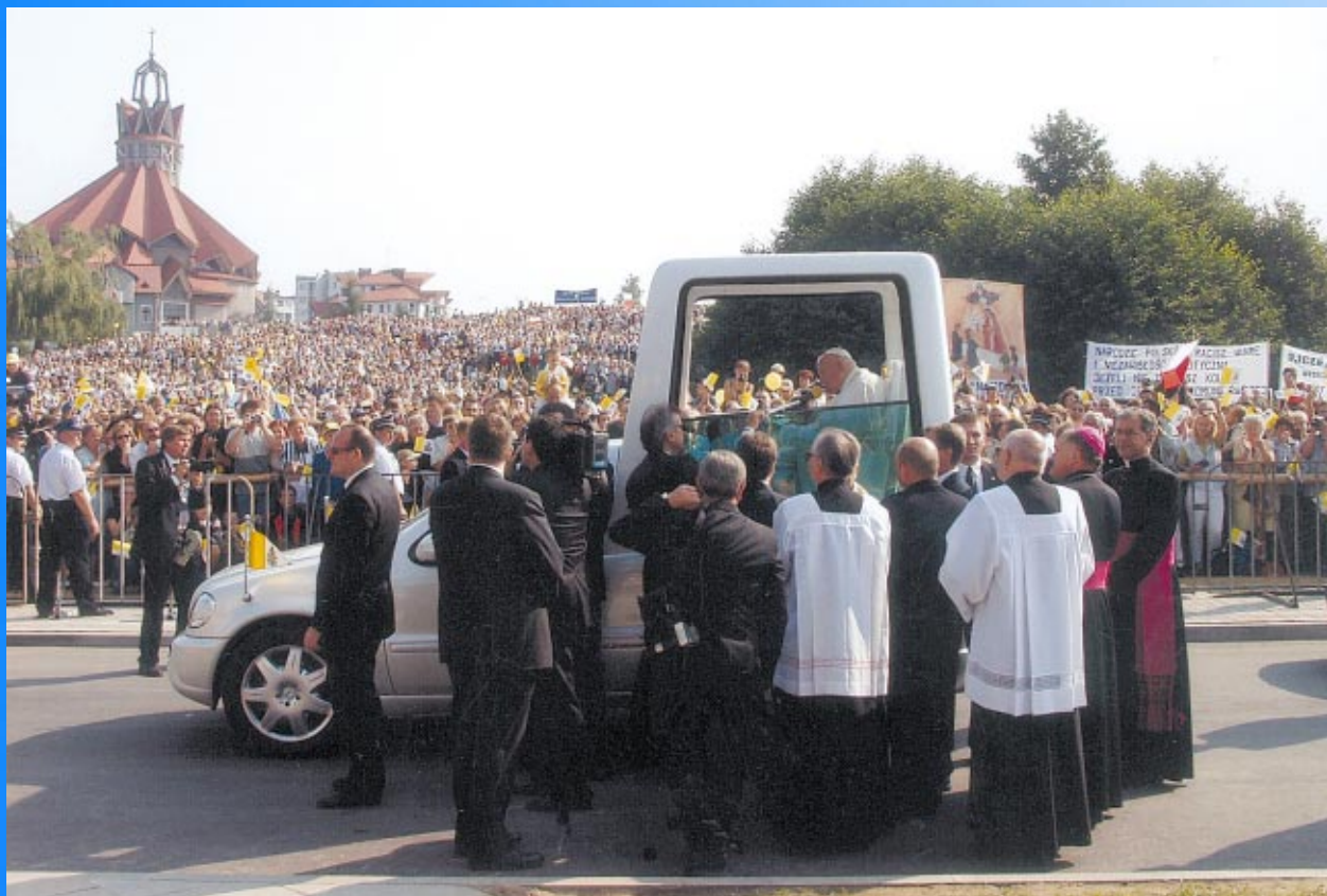
19 sierpnia 2002 rok – Ojciec Święty w Skawinie