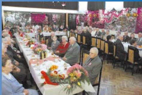
Jubileusz Złotych Godów str. 12-13