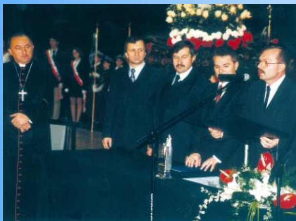
Uroczystość nadania tytułu Honorowego Obywatela Miasta i Gminy Skawina