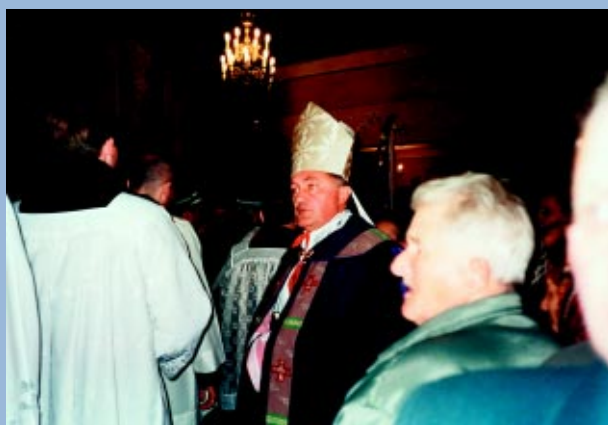
Kościół pw. św.św. App. Szymona i Judy, 2000 rok