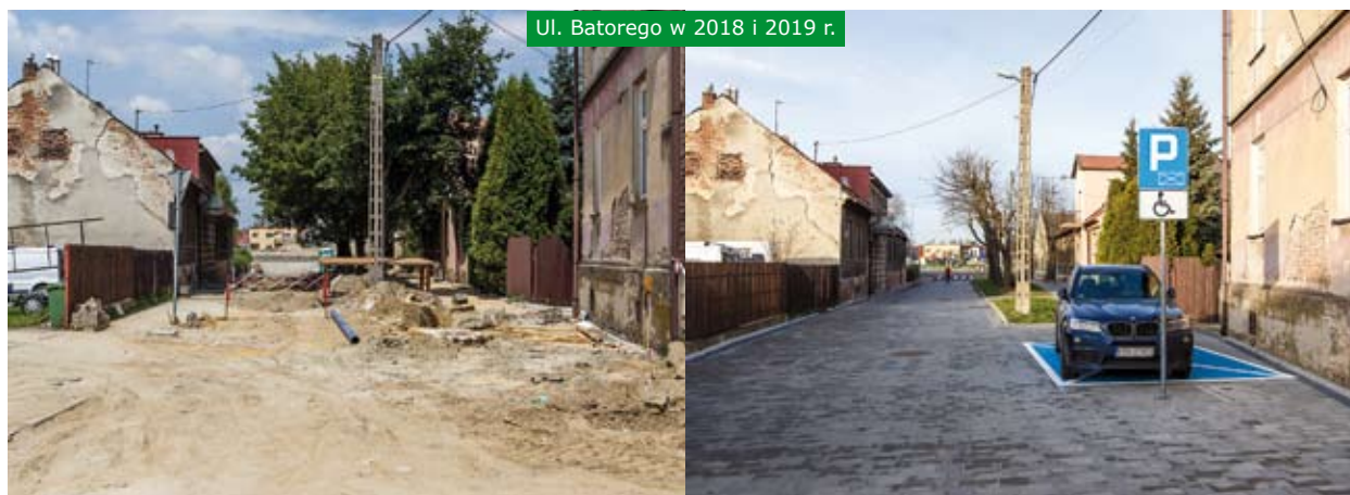
Ul. Batorego w 2018 i 2019 r.