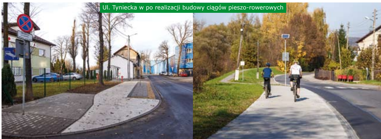
Ul. Tyniecka w po realizacji budowy ciągów pieszo-rowerowych

Większość ciągów pieszo-rowerowych budowanych jest w miejscu starego chodnika, zwykle wyraźnie zniszczonego. Taką sytuację mieliśmy w przypadku ulic: Radziszowskiej – chodnik wybudowany