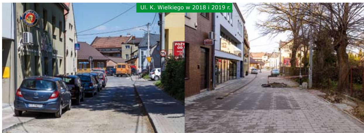
Ul. K. Wielkiego w 2018 i 2019 r.

w latach 80. ubiegłego wieku oraz Tynieckiej. Realizując inwestycje, staramy się zawsze tak je planować, by zachowywać możliwie najwięcej istniejącej zieleni i drzew, przykład ul. Żwirki i Wigury obok Szkoły Podstawowej nr 2 oraz Liceum czy dalej na tej samej ulicy, gdzie ciągi zostały zwężone tak, by cenne lipy nie zostały ścięte. Zachowana została również m.in. piękna lipa na skrzyżowaniu ulic: Żwirki i Wigury z Marii Konopnickiej, lipy przy Miejsko-Gminnym Ośrodku Pomocy Społecznej, ominięto brzozę w ciągu budowanym wzdłuż ulic: Ogrody i 29-go Listopada oraz wiele innych drzew na trasie zaprojektowanych ciągów pieszo-rowerowych.