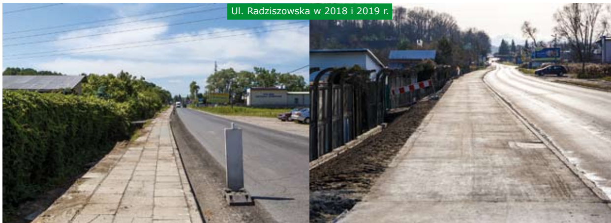
Ul. Radziszowska w 2018 i 2019 r.

częściej odwiedzają. To między innymi szkoła, przedszkole, dworzec, kościół itd. Kolejną jest rower – aktualnie budowana infrastruktura poprawia komfort przemieszczania