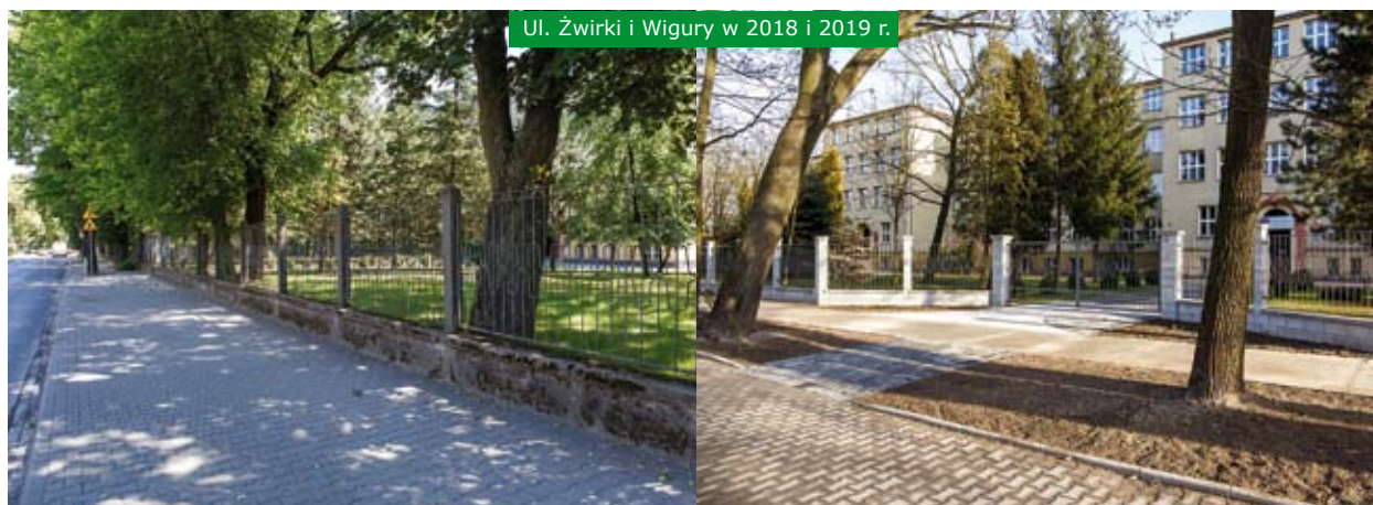
Ul. Żwirki i Wigury w 2018 i 2019 r.