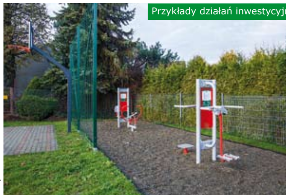
Przykłady działań inwestycyjnych w obszarze rewitalizacji

Więcej informacji na temat rewitalizacji można także znaleźć na stronie internetowej lub profilu FB urzędu oraz w materiałach drukowanych dostępnych w Urzędzie, u Sołtysów oraz Przewodniczących Zarządów Osiedli.