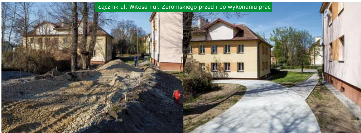
Łącznik ul. Witosa i ul. Żeromskiego przed i po wykonaniu prac

rowerzystom małym i dużym oraz mamom z wózkami czy osobom niepełnosprawnym, ale też seniorom ciągnącym wózki z zakupami, osobom z ograniczeniami ruchowymi. Co dla nas bardzo ważne również