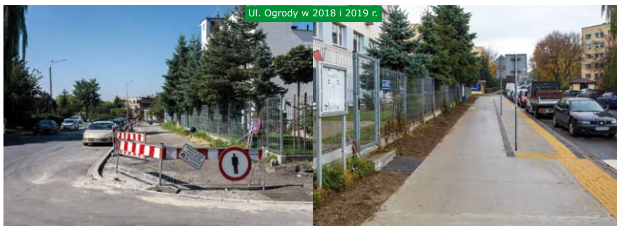
Ul. Ogrody w 2018 i 2019 r.

Chcemy dać mieszkańcom możliwość skorzystania z wygodnych alternatyw dla samochodów. Jedną z nich jest autobus ekologiczny (linia 773), który jeździ po terenie miasta Skawina. Przystanki zlokalizowane zostaną na osiedlach oraz miejscach, które mieszkańcy naj-