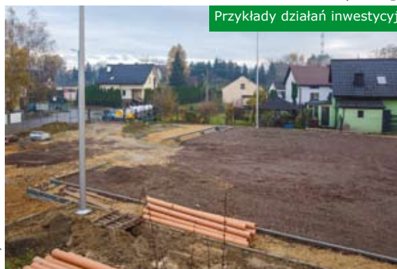
Przykłady działań inwestycyjnych w obszarze rewitalizacji

- Bardzo się cieszę z dotychczasowych rezultatów realizacji przedsięwzięć rewitalizacyjnych. Budujące jest mocne zaangażowanie mieszkańców, bez których niewiele udało się zrobić. Zachęcamy wszystkich zainteresowanych włączeniem się w proces rewitalizacji do kontaktu z Sołtysami, Przewodniczącymi Zarządów Osiedli lub Wydziałem Rozwoju i Strategii