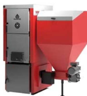
Kocioł na ekogroszek

Po sporządzeniu audytu energetycznego budynku Domu Ludowego w Woli Radziszowskiej planuje się wykonanie jego kompleksowej termomodernizacji. Ma ona polegać na ociepleniu budynku, co zmniejszy zapotrzebowanie energetyczne budynku oraz modernizacji instalacji grzewczej poprzez likwidację kotłowni węglowej. Nowym źródłem ciepła ma być kondensacyjny kocioł gazowy wraz z pompą ciepła zasilane fotowoltaiką. Pierwszy etap prac związany z modernizacją instalacji grzewczej zaplanowano na rok 2017.