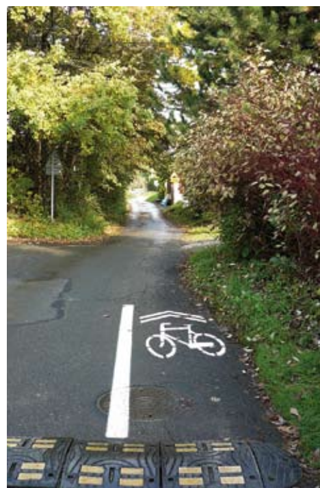
Fot. R. Gdula

18 października na jednokierunkowych ulicach naszego miasta, tj. ul. Ogrody i Wiklinowej, został dopuszczony ruch rowerem „pod prąd”, czyli tzw. kontraruch rowerowy. Nowe zasady wprowadzone zostały na tych odcinkach, gdzie ulice były jednokierunkowe dla wszystkich pojazdów. To rozwiązanie umożliwia skracanie drogi, zwiększa wygodę i bezpieczeństwo rowerzystów poprzez ominięcie niebezpiecznych ulic i skrzyżowań, także ulic o znacznej różnicy wzniesień. Wprowadzenie kontraruchu jest jedną z form zachęcania mieszkańców do wyboru roweru jako środka transportu w mieście i gminie Skawina