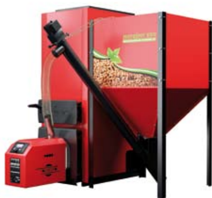
Kocioł na pellet