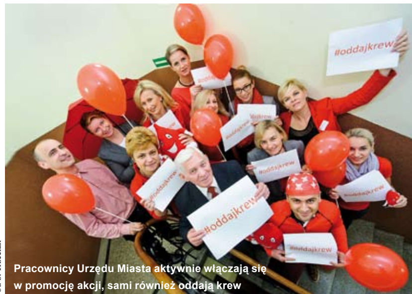
Pracownicy Urzędu Miasta aktywnie włączają się w promocję akcji, sami również oddają krew

Organizatorem plebiscytu „Poza Stereotypem – Senior Roku” jest Regionalny Ośrodek Polityki Społecznej w Krakowie. W dotychczasowych edycjach wydarzenia łącznie nagrodzono 18 seniorów, a wyróżniono 33.