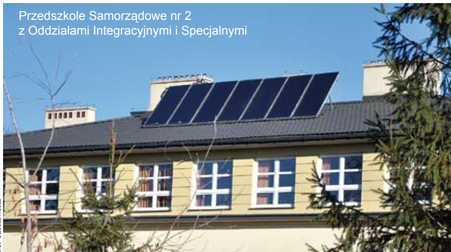
Przedszkole Samorządowe nr 2 z Oddziałami Integracyjnymi i Specjalnymi