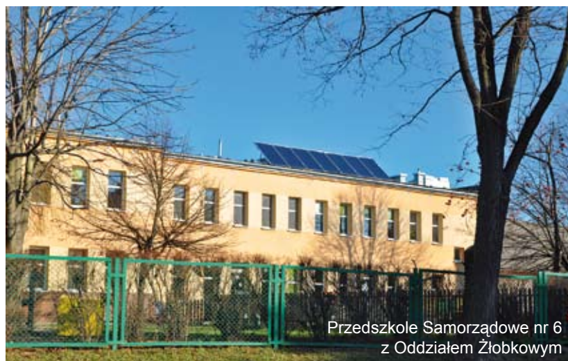
Przedszkole Samorządowe nr 6 z Oddziałem Żłobkowym

W roku 2016 projektem zostaną objęte jeszcze dwa budynki: Zespół Szkół Publicznych w Radziszowie oraz Basen „Camena”, gdzie zostaną zainstalowane panele fotowoltaiczne do produkcji prądu elektrycznego wraz z pompami ciepła. Dodatkowo w budynkach tych zostanie wykonana termomodernizacja.