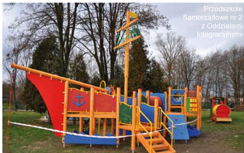
Przedszkole Samorządowe nr 2 z Oddziałami Integracyjnymi

zszkoli. Kwoty te przeznaczone są na zakup nowych elementów wyposażenia placów zabaw. W praktyce oznacza to wymianę starych zużytych i nie spełniających wymogów bezpieczeństwa elementów. Nowe, wykonywane z ekologicznych materiałów, posiadają atesty bezpieczeństwa.