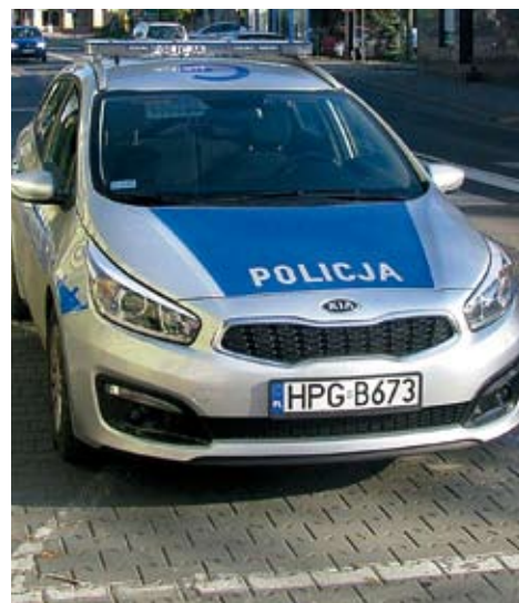
Komisariat Policji w Skawinie

Zakup nowego radiowozu oznakowanego, współfinansowanego