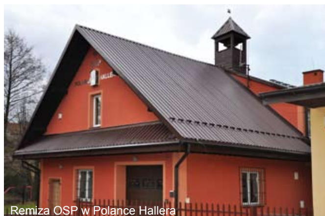
Remiza OSP w Polance Hallera

Wartość zadania wyniosła 59 547,29 zł, w tym kwota dotacji 29 773,64 zł (50% wartości zadania).